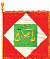
Repubblica Italiana (1802-1805)

L'11 maggio, successivo viene sanzionata e deliberata la scelta della Bandiera della Nazione Cisalpina da adottare per la costituenda "Repubblica" preannunciata da Napoleone. In variante al precedente tricolore, tre bande parallele all'asta. In successione: verde, bianco e rosso.