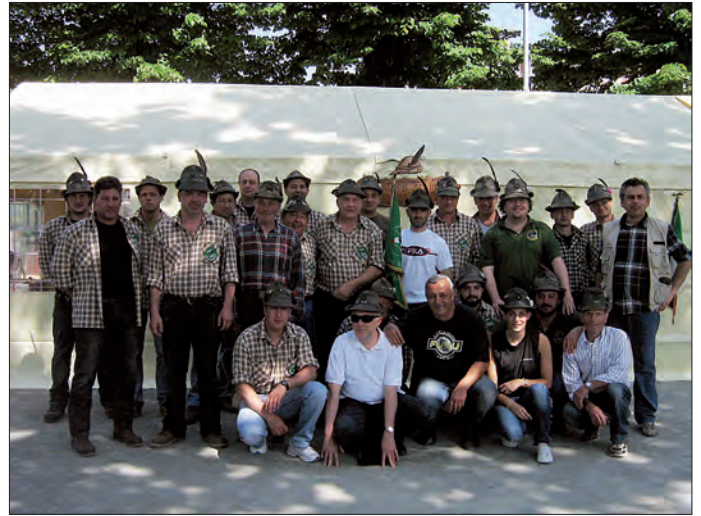
Gli Alpini di Guida all'Adunata

Il tema adunata è quello che ha tenuto banco nella primavera, quest'anno svoltasi a Torino, il nostro gruppo vi ha partecipato come ogni anno risolvendo brillantemente tutti problemi