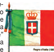
Regno d'Italia (1861)