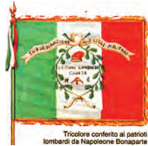
Tricolore conferito ai patrioti lombardi da Napoleone Bonaparte

Ma il "tricolore" è ben più anziano dell'Unità d'Italia. È più che "bicentenario"! Lo sapevate? Ebbene, nel lontano "1796", nel corso della guerra contro