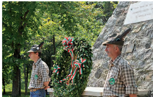
Cerimonia ufficiale al Cippo con corona e alzabandiera