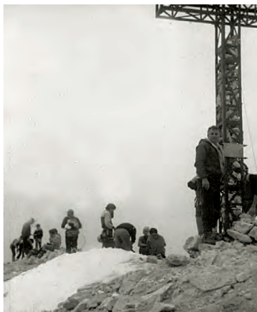
La croce svetta ancora calda sulla cima

fetta di soppresa, per cui brontolando e sbuffando si arrivò alla base dell'anticima, dove li attendeva il tratto più pericoloso: lo spigolo del crinale Nord-Est, uno spazio largo meno di un metro con lo strapiombo da una parte ed il ghiacciaio dall'altra.