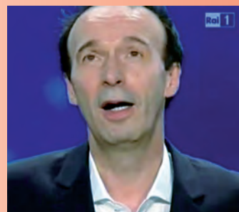
Roberto Benigni canta l'Inno nazionale a Sanremo 2011, dopo averlo spiegato agli spettatori.

12 "Il sangue d'Italia, il sangue Polacco" qui Mameli assimila le sorti del popolo italiano a quello polacco: due Nazioni che l'Austria aveva dominato e diviso. La Polonia gli austriaci l'avevano divisa con gli Zar di Russia (ecco il riferimento al Cosacco).