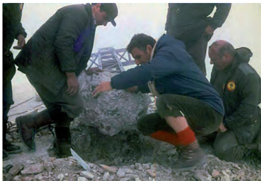
Ricostruire la sede della croce,