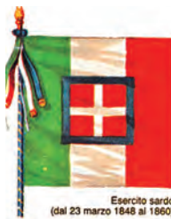
Esercito sardo (dal 23 marzo 1848 al 1860)

RGB (monitor video) V=(0-146-70) B=(225-255-255) R=(203-43-55)