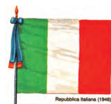
Repubblica Italiana (1946)