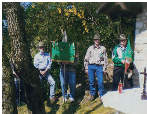
Festa del 1° Maggio