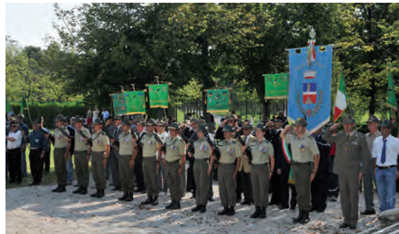
Labari delle sezioni alpine e associazioni d'arma