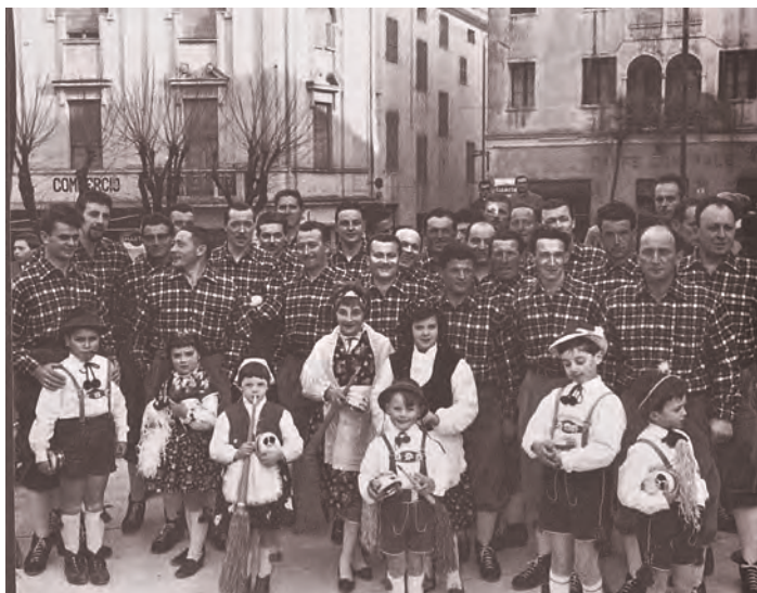
Festeggiamenti del Carnevale 1962 in Piazza Marconi: prima foto ufficiale del "Coro Monte Cesen" costituitosi nell'Ottobre 1961.

Alla fine del mese di ottobre 1961, si legge, prende vita in "Canonica" il coro, che poi prenderà nome: "Coro Monte Cesen". Tutto vero, ma tale asserzione potrebbe trarre in inganno in quanto, sì, molti di quei primi fondatori cantavano anche con la "cantoria parrocchiale", ma prima di quella data esisteva già un complesso corale, senza nome, mirabilmente diretto dal caro maestro Vittorio Dall'Armi, organista della Arcipretale Santa Maria Assunta da una vita, con repertorio misto di arcinoti brani di musica classico