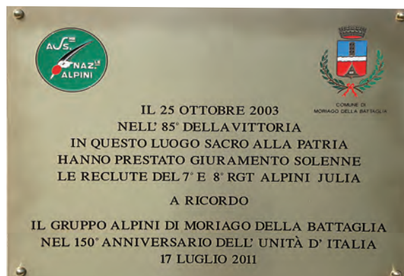
Il testo della targa ricordo