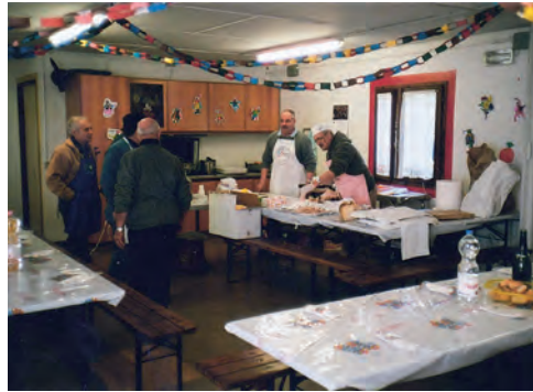
Carnevale con l'A.L.I.