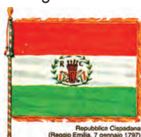
Repubblica Cisalpina (Reggio Emilia, 7 gennaio 1797)

l'Impero Asburgico, condotta dalla Francia, un reparto di volontari italiani, nato dai moti di insofferenza ferventi a quel tempo, affiancato alle truppe francesi, nominato "Legione Lombarda", ebbe l'ambito privilegio di portare in combattimento il "primo tricolore italiano" ("vendemmiaio", anno V, 8 ottobre 1796), diretta derivazione dalla bandiera della Rivoluzione francese, con il verde al posto del bleu e, al centro del bianco, un "berretto frigio" con sopra la scritta: LEGIONE LOMBARDA - COORTE N° 6 e, sotto, un "Archipendolo", contornati da un "serto con foglie e bacche di quercia", il tutto sovrastato da un cartiglio svolazzante con la scritta: SUBORDINAZIONE ALLE LEGGI MILITARI. Asta a sinistra, di colore giallo