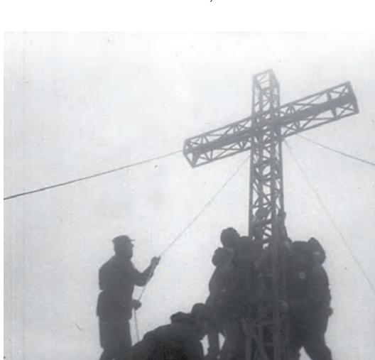
Fissaggio dei tiranti e rimessa in verticale della croce