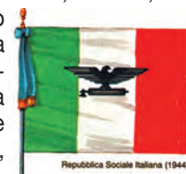
Repubblica Sociale Italiana (1944)