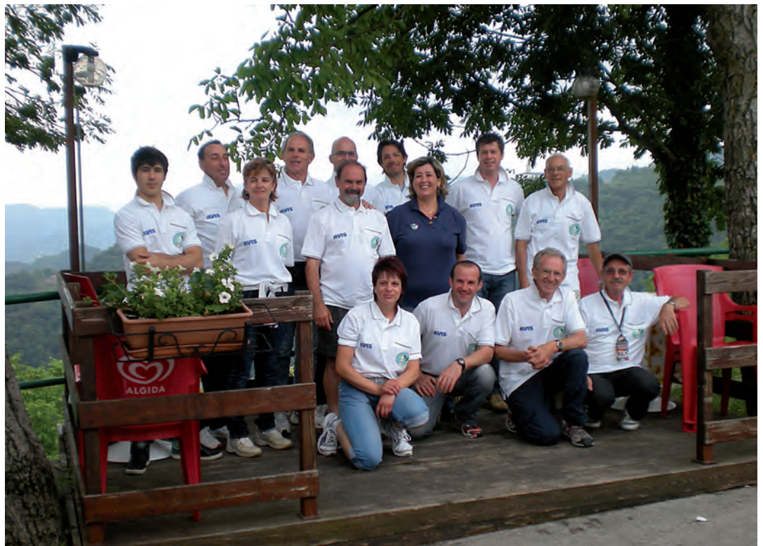
Alcuni atleti del nostro Gruppo

della stagione 2011 di ANA Valdobbiadene Campionato regionale Veneto: