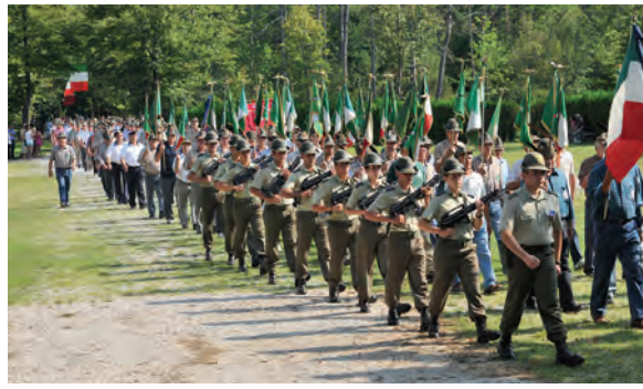
Bellissimo viale imbandierato